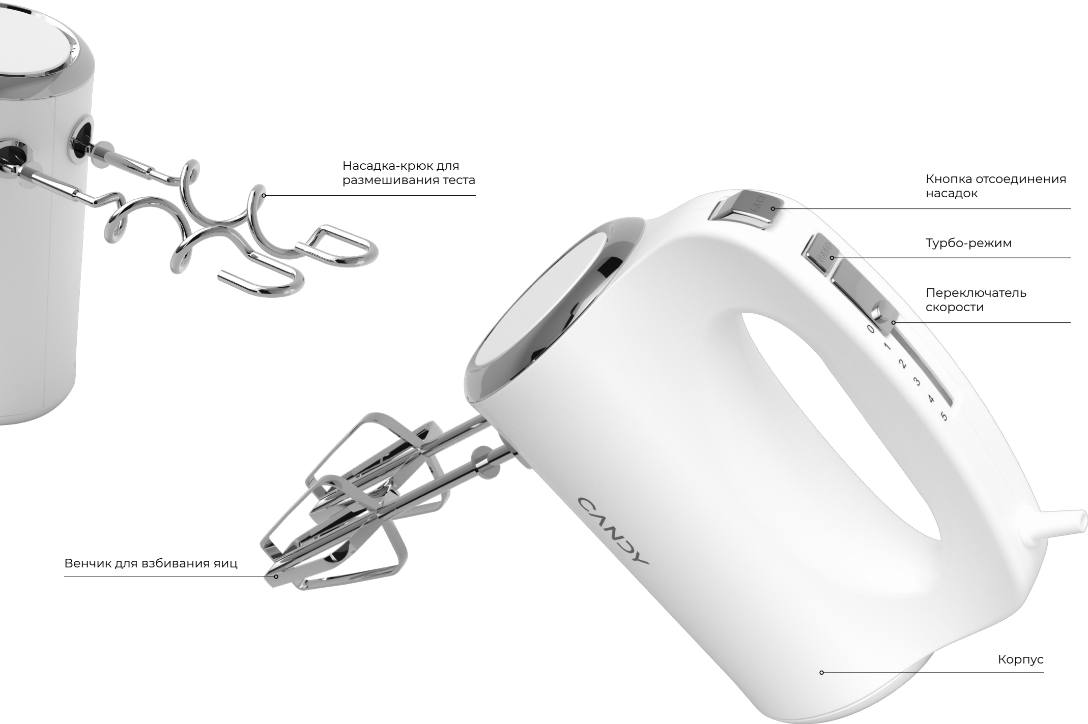
Насадка-крюк для размешивания теста