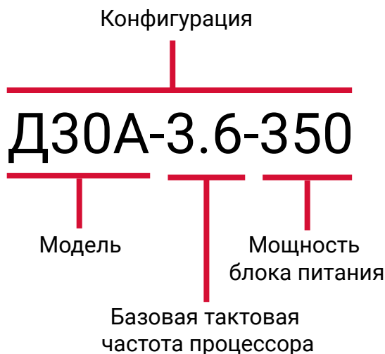
Рисунок 1 – Пример обозначения конфигурации ПК «Гравитон»

Обозначение конфигурации ПК «Гравитон» формируется из его модели, значения базовой тактовой частоты центрального процессора (ГГц) и мощности блока питания (Вт). Пример обозначения конфигурации представлен на рисунке 1.