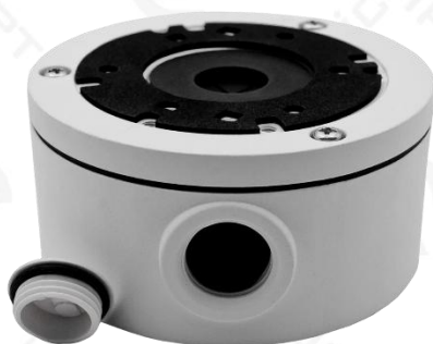
Монтажная коробка IPTRONIC IPT-JB131